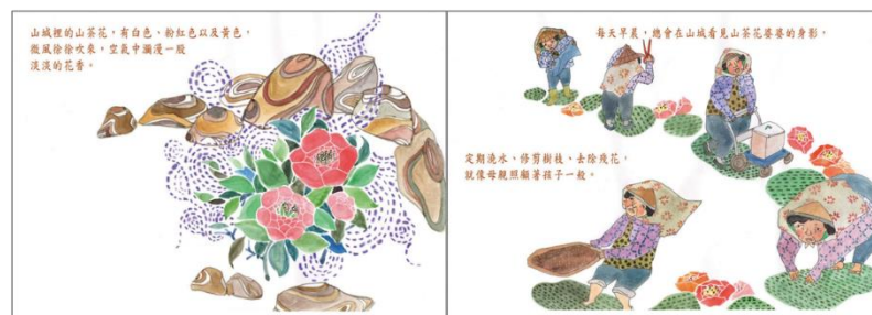
※範例作品：教育部反毒繪本—山茶花婆婆/洪孟真、呂舒婷